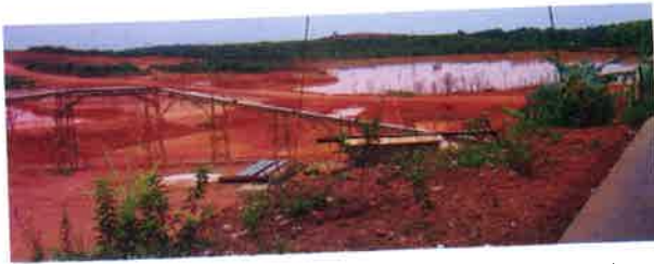
Gambar 6. Tailing bauksit PT. Aneka Tambang, lokasi daerah Wacopek, Kabupaten Bintan (Rohmana dkk. 2007)

Pasir. Bahan galian pasir dijumpai melimpah di wilayah P. Bintan, merupakan rombakan granit, bauksit, dan batupasir tufan (Formasi Goungon). Potensi pasir seluruhnya mempunyai luas sebaran 1.114 ha dengan jumlah sumber daya tereka sebesar 223 juta m 3 (Gambar 7).