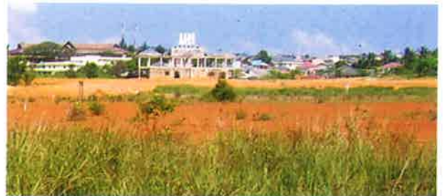
Gambar 12. Daerah bekas tambang bauksit PT. Aneka Tambang di Tanjung Pinang, sebagian untuk pemukiman penduduk dan pertokoan (Rohmana, dkk. 2007)

Sehubungan dengan meningkatnya perkembangan penduduk yang memerlukan tambahan lahan untuk pemukiman, maka sebagian areal bekas tambang dimanfaatkan untuk pemukiman penduduk, bahkan pengembangan Kota Tanjung Pinang (Gambar 12).