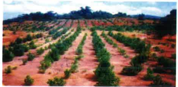
Gambar 11. Revegetasi dengan pohon jengkol dan petai di Lomessa (Lahar dkk, 2003)

Penambangan bauksit di daerah kegiatan menggunakan sistem penambangan terbuka, pengupasan tanah pucuk 0,30 m, sedangkan tebal maksimum bahan galian bauksit sekitar 5,0 m,