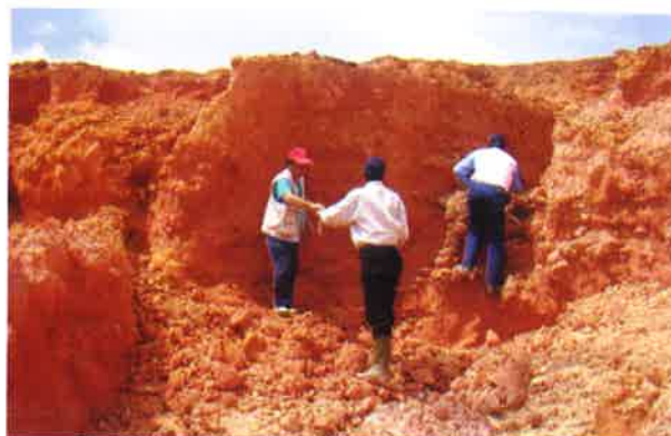
Gambar 9. Bauksit tersisa di atas batuan dasar (Rohmana, dkk. 2007)

Untuk menghindari pengotoran dari batuan dasar yang ikut tergali pada saat penambangan bauksit, maka penggalian dilakukan dengan menyisakan bauksit setebal 40 – 50 cm di atas batuan dasarnya. Selain menghindari tercampurnya bauksit dengan batuan dasar, sisa tanah mengandung bauksit juga berfungsi untuk penanaman pohon reklamasi (Gambar 9).