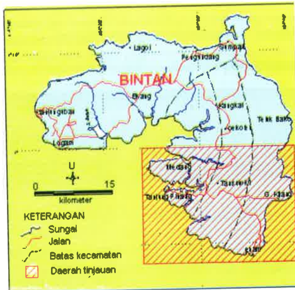
Gambar 1. Peta Pulau Bintang

Terutama bahan galian bauksit, dimana perkembangan harganya yang sangat signifikan berkaitan dengan peningkatan tidak hanya nilai jual tetapi juga karena perubahan faktor COG ( Cut off Grade ), sehingga cadangan bauksit yang pada masa sebelumnya termasuk kategori berkadar rendah, menjadi ekonomis untuk diusahakan. Akibatnya wilayah bekas tambang yang masih menyisakan bauksit kadar rendah, menjadi daerah menarik dan berpotensi untuk diusahakan kembali.