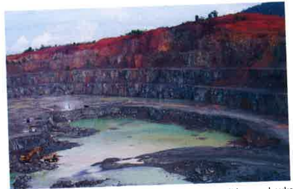
Gambar 8. Tanah penutup (kecoklatan) tambang granit berupa bauksit kadar rendah (Rohmana, dkk. 2007)

Tanah Penutup Granit. Tanah lapukan granit (Gambar 8) di daerah ini mempunyai kandungan Al 2 O 3 11,02% - 25,37%. Bauksit yang merupakan tanah penutup granit masih berpotensi untuk dimanfaatkan mengingat kandungannya tersebut dan pada saat penambangan granit akan ikut terkupas.