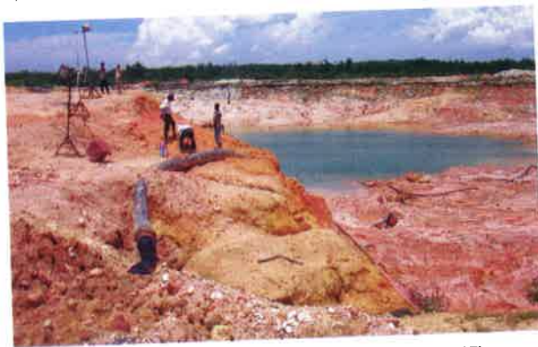
Gambar 7. Pertambangan pasir (Rohmana dkk. 2007)

Pasir. Bahan galian pasir dijumpai melimpah di wilayah P. Bintan, merupakan rombakan granit, bauksit, dan batupasir tufan (Formasi Goungon). Potensi pasir seluruhnya mempunyai luas sebaran 1.114 ha dengan jumlah sumber daya tereka sebesar 223 juta m 3 (Gambar 7).