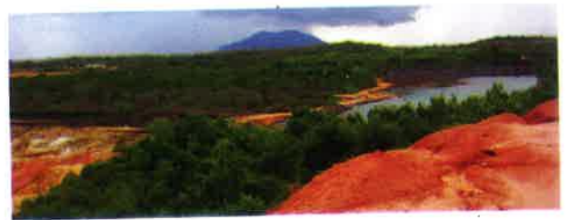
Gambar 2. Morfologi Daerah Wacopek, latar belakang Bukit Bintang Besar (sumber : Rohmana, dkk, 2007)

Batuan beku lain berupa andesit berumur Miosen yang ditemukan menerobos granit, sementara formasi batuan dengan sebaran cukup luas berupa batupasir tufan yang diduga berumur Miosen-Pliosen.