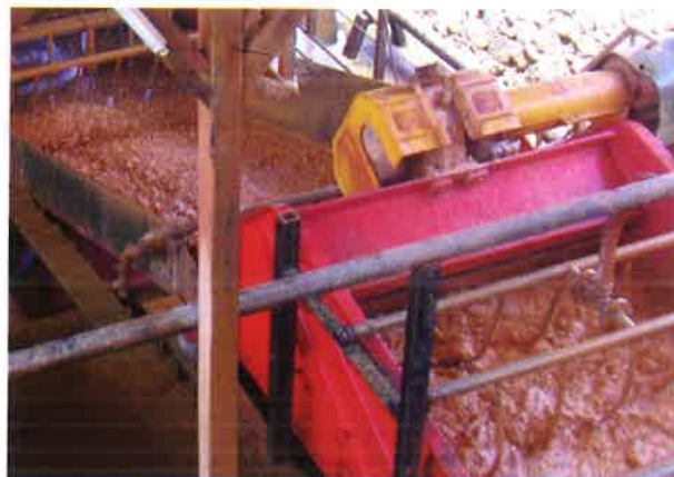
Gambar 10. Pencucian bijih bauksit (Rohmana, dkk. 2007)

Proses pencucian yang dilakukan pada instalasi pencucian bertujuan untuk meliberasi bijih bauksit terhadap unsur-unsur pengotornya yang pada umumnya berukuran -2 mm yaitu berupa tanah liat ( clay ) dan pasir kuars. Sehingga hasil dari proses pencucian tersebut akan mempertinggi kualitas bijih bauksit, yaitu didapatkan kadar alumina yang lebih tinggi dengan berkurangnya kadar silika, oksida besi, oksida titan dan mineral-mineral pengotor lainnya.