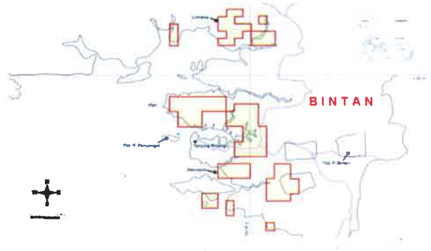
Gambar 4. Peta lokasi tambang bauksit (Lahar dkk, 2003)

di seluruh wilayah tersebut pada sebaran luas sekitar 10.450 ha dengan jumlah sumber daya tereka sebesar 209 juta m 3 .