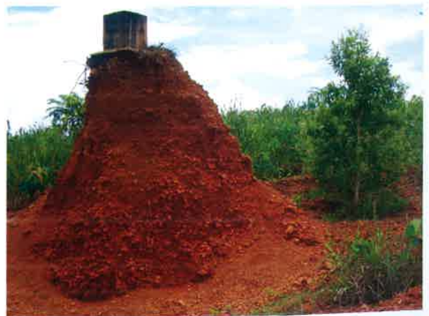
Gambar 5. Laterit bauksit yang disisakan, tidak ditambang (Rohmana dkk. 2007)

Terdapat beberapa wilayah bekas tambang di P. Bintan di antaranya P. Koyang, daerah Wacopek, daerah Tanjung Pinang dan sekitarnya. Daerah tersebut merupakan wilayah bekas tambang bauksit PT. Aneka Tambang, dimana terdapat bijih bauksit tertinggal (Gambar 5) dengan ketebalan sampai batuan dasar sekitar 40 hingga 50 cm (rata-rata 45 cm), sedangkan bahan galian bijih bauksit sebelum ditambang mempunyai ketebalan 1-5 meter. Bekas tambang di daerah Tanjung Pinang dan sekitarnya, telah menjadi wilayah perkantoran, perumahan padat penduduk dan pertokoan.